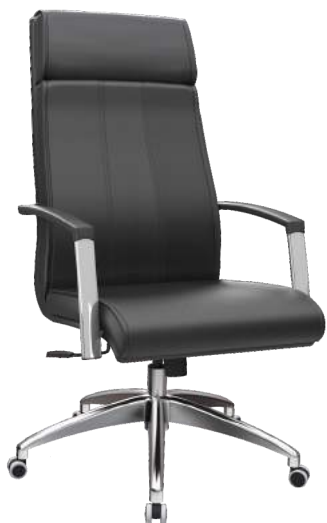
Presidente cód. 42452