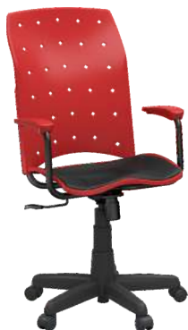
Presidente cód. 33682