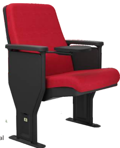
Poltrona com Prancheta Lateral cód. 46468