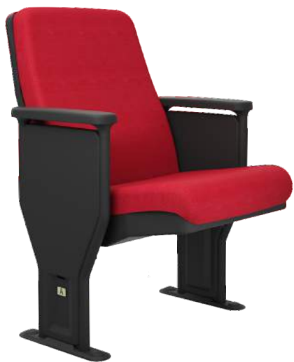
Poltrona cód. 46468