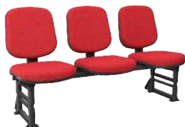
Longarina Diretor cód. 39342