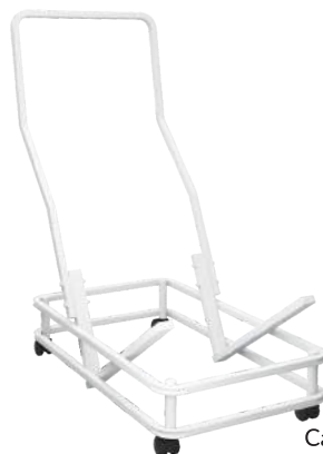
Carrinho de Transporte cód. 41076