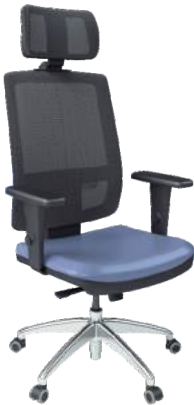
Tela Presidente cód. 37811