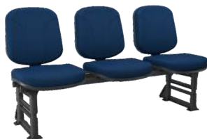
Longarina Diretor cód. 28451