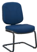
Diretor S cód. 30508