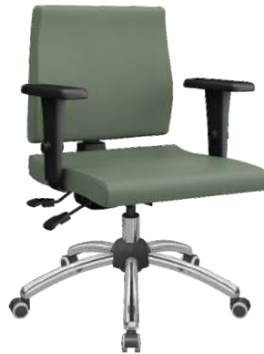
Executiva cód. 25102