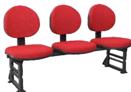
Longarina Executiva cód. 39343