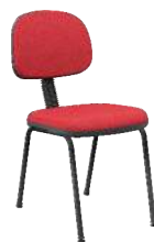
Secretária 4 Pés Slim cód. 39742