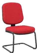
Diretor S cód. 39337