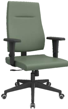
Presidente cód. 25187