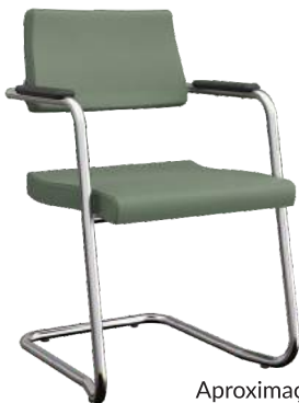
Aproximação S cód. 25524