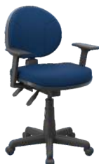
Executiva Backplax cód. 30473