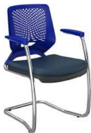
Aproximação S cód. 39002