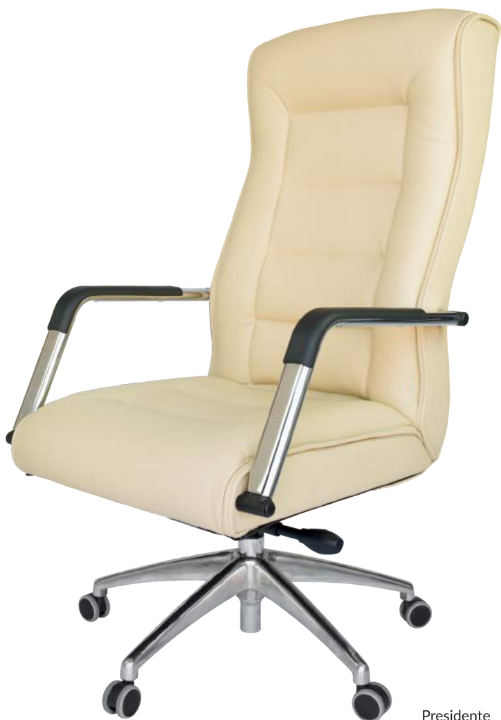
Presidente cód. 53320