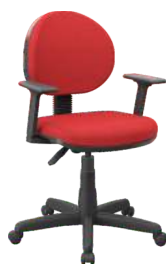
Executiva Lâmina cód. 39328