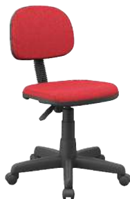
Secretária Slim cód. 39777