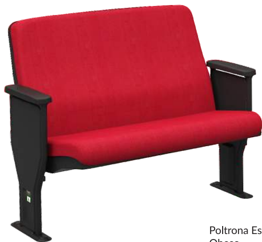
Poltrona Especial para Obeso cód. 44910