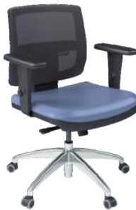
Tela Executiva cód. 37877