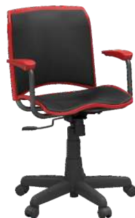
Diretor cód. 33690