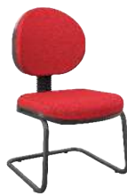
Executiva S cód. 39339