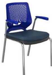
4 Pés com Braço cód. 39003