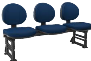
Longarina Executiva cód. 28452