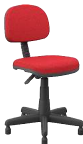
Secretária com Sapata cód. 39334