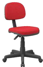
Secretária cód. 39333