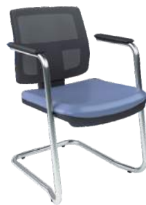
Tela Aproximação S cód. 37881