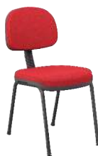
Secretária 4 Pés cód. 39341