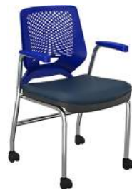
4 Pés com Rodízio cód. 39004