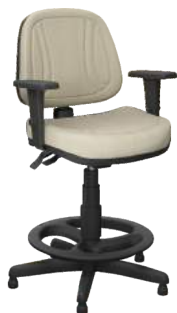
Executiva Caixa cód. 33083