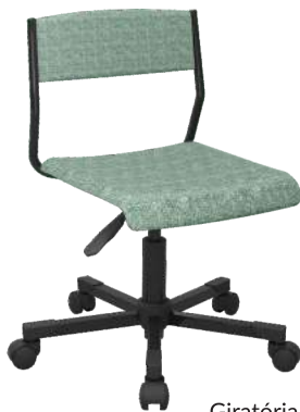
Giratória Estofada cód. 39847