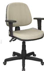
Executiva Backplax II cód. 37200