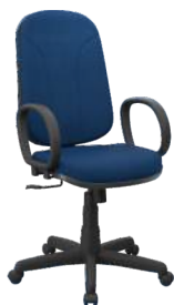
Presidente cód. 30499