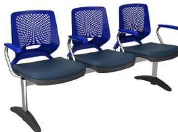
Longarina cód. 39007