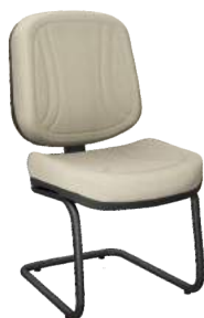
Diretor S cód. 33060