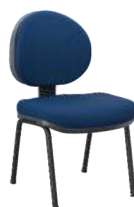
Executiva 4 Pés cód. 30502