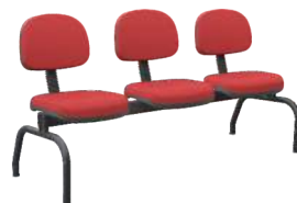
Longarina Secretária cód. Plus 47368 cód. Plus Slim 47109