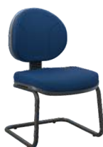
Executiva S cód. 30507