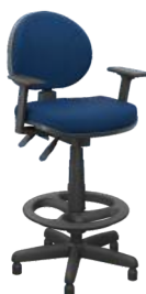
Executiva Caixa cód. 30441