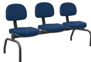
Longarina Secretária cód. 47369