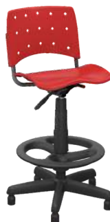
Secretária Caixa cód. 37031