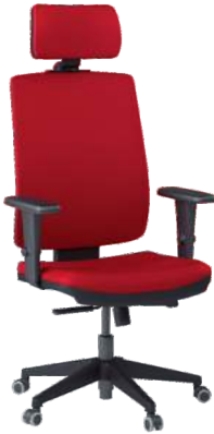
Soft Presidente cód. 37858