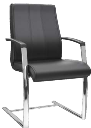
Aproximação S cód. 46812