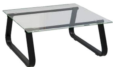
Mesa Quadrada 70 x 70 mm cód. 40040