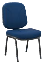
Diretor 4 Pés cód. 30505