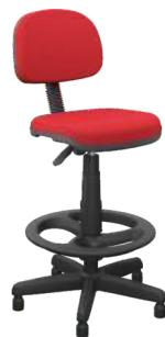
Secretária Caixa cód. 39336