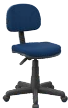
Secretária cód. 30421