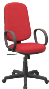
Presidente cód. 39326