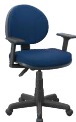
Executiva Lâmina cód. 30472