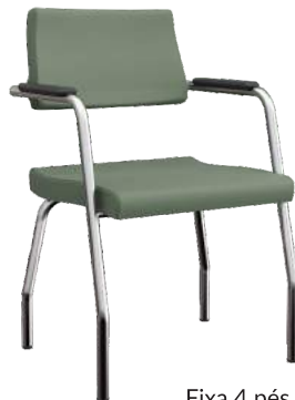
Fixa 4 pés cód. 25525