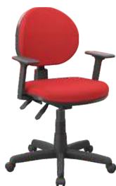
Executiva Backplax cód. 39329