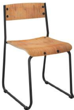
Fixa cód. 39851 (montada) cód. 42767 (desmontada)