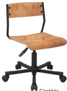
Giratória cód. 39847