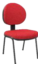
Executiva 4 Pés cód. 39340