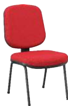
Diretor 4 Pés cód. 39338