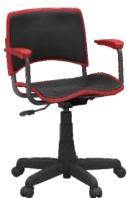
Secretária cód. 33970