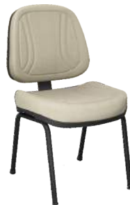
Executiva 4 Pés cód. 32333