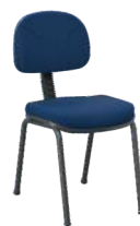
Secretária 4 Pés cód. 37430