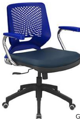
Giratória Braço Fixo cód. 39000