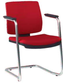
Soft Aproximação S cód. 37882