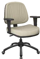
Executiva Lâmina cód. 33084