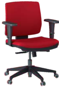
Soft Executiva cód. 37880