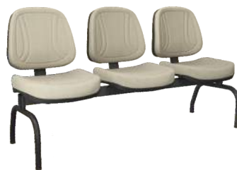
Longarina Executiva cód. 33975