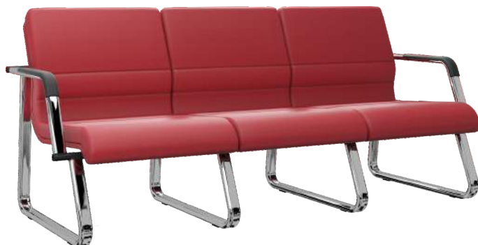
Conjugado de 2 à 4 Lugares cód. 39969