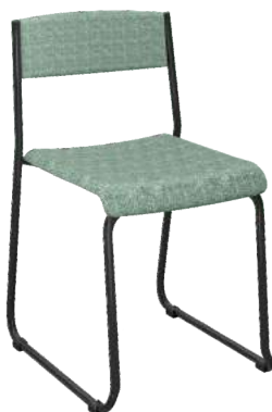
Fixa Estofada cód. 39851 (montada) cód. 42767 (desmontada)