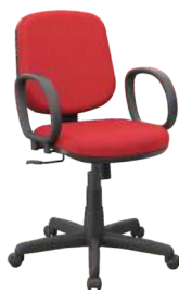
Diretor cód. 39327