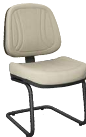
Executiva S cód. 33157