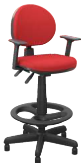
Executiva Caixa cód. 39335