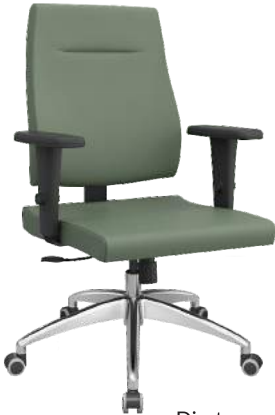
Diretor cód. 25422