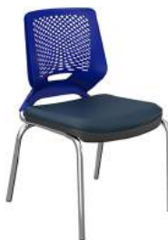
4 Pés sem Braço cód. 39003