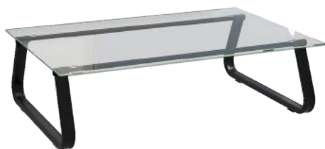
Mesa Retangular 70 x 110 mm cód. 40039