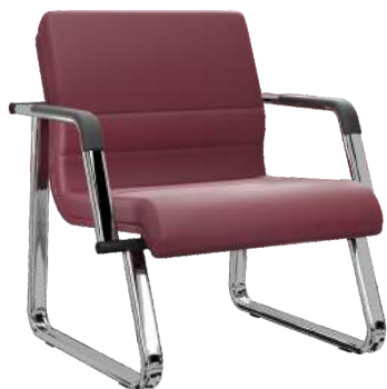
Individual cód. 39969