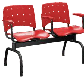
Longarina cód. 37904