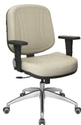
Diretor cód. 33064