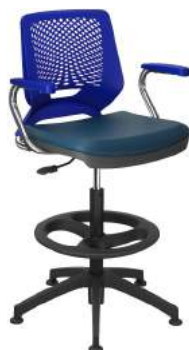
Caixa cód. 39005