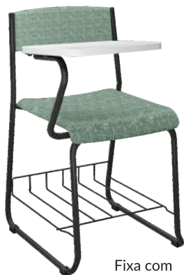
Fixa com Prancheta Lateral cód. 39850