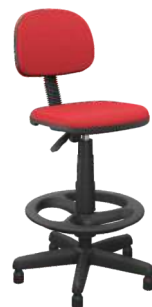
Secretária Caixa Slim cód. 39778