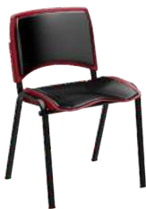
Fixa Secretária ou Diretor cód. 34749 (montada) cód. 34532 (desmontada)