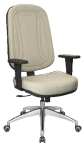
Presidente cód. 32329