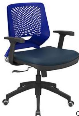
Giratória Braço Regulável cód. 39000